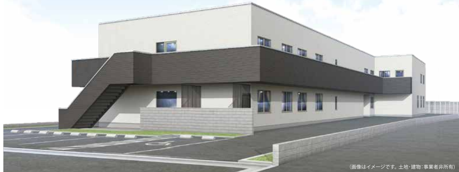
(画像はイメージです。土地・建物・事業者非所有)