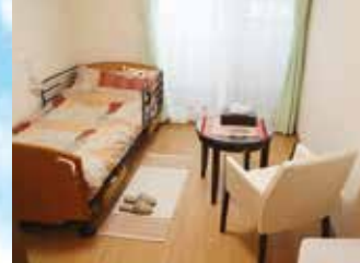
※写真はグループ他施設の設備