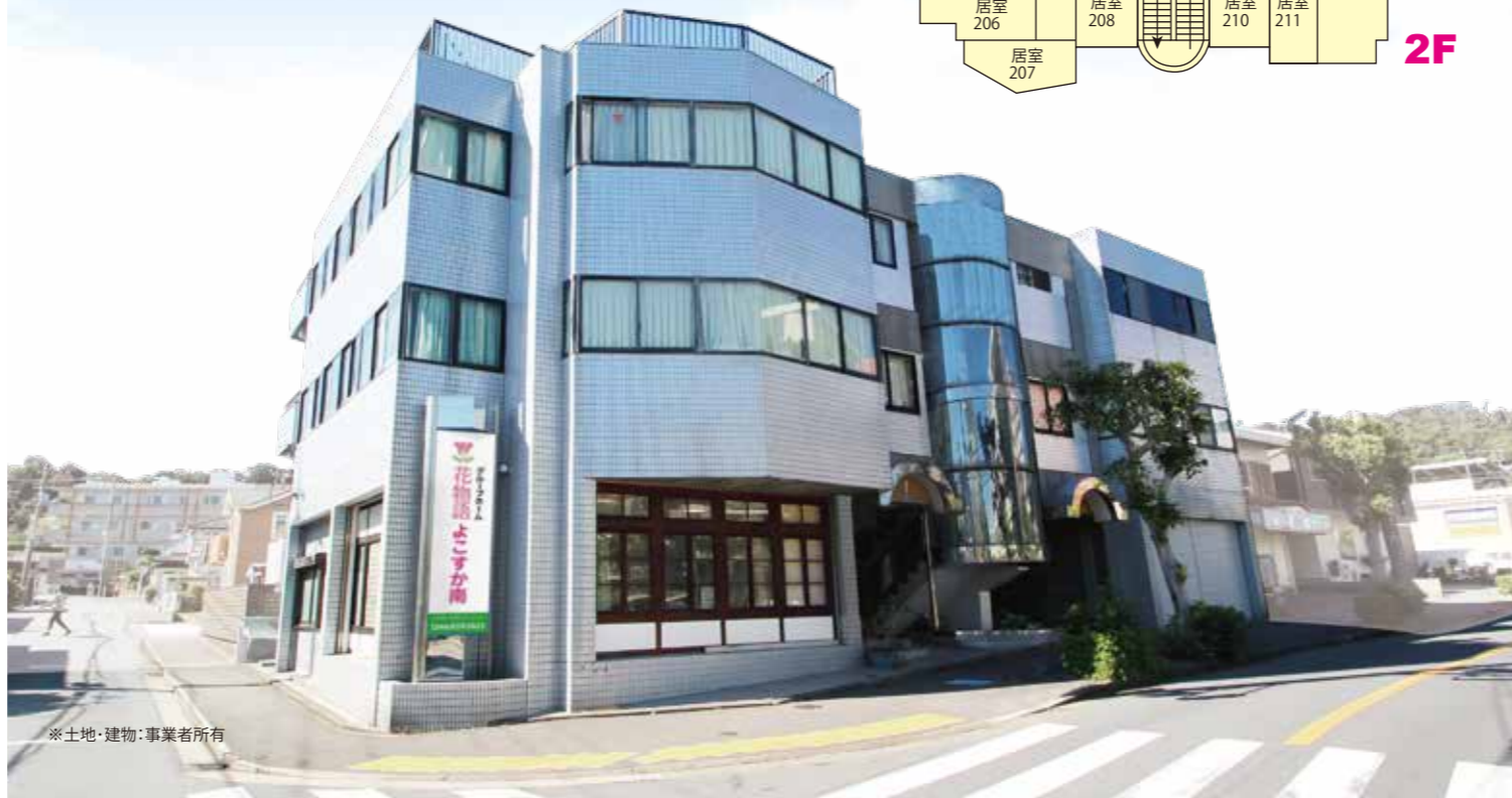
※土地・建物：事業者所有