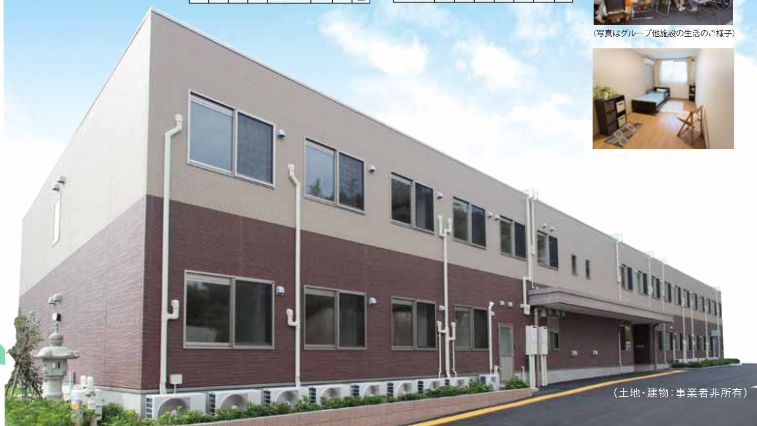
(土地・建物：事業者非所有)