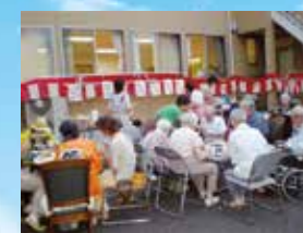
(写真はグループ他施設の生活の様子)