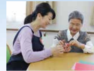
※写真はイメージ写真です