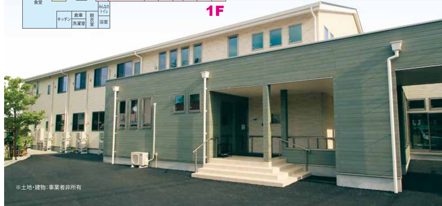
※土地・建物：事業者非所有