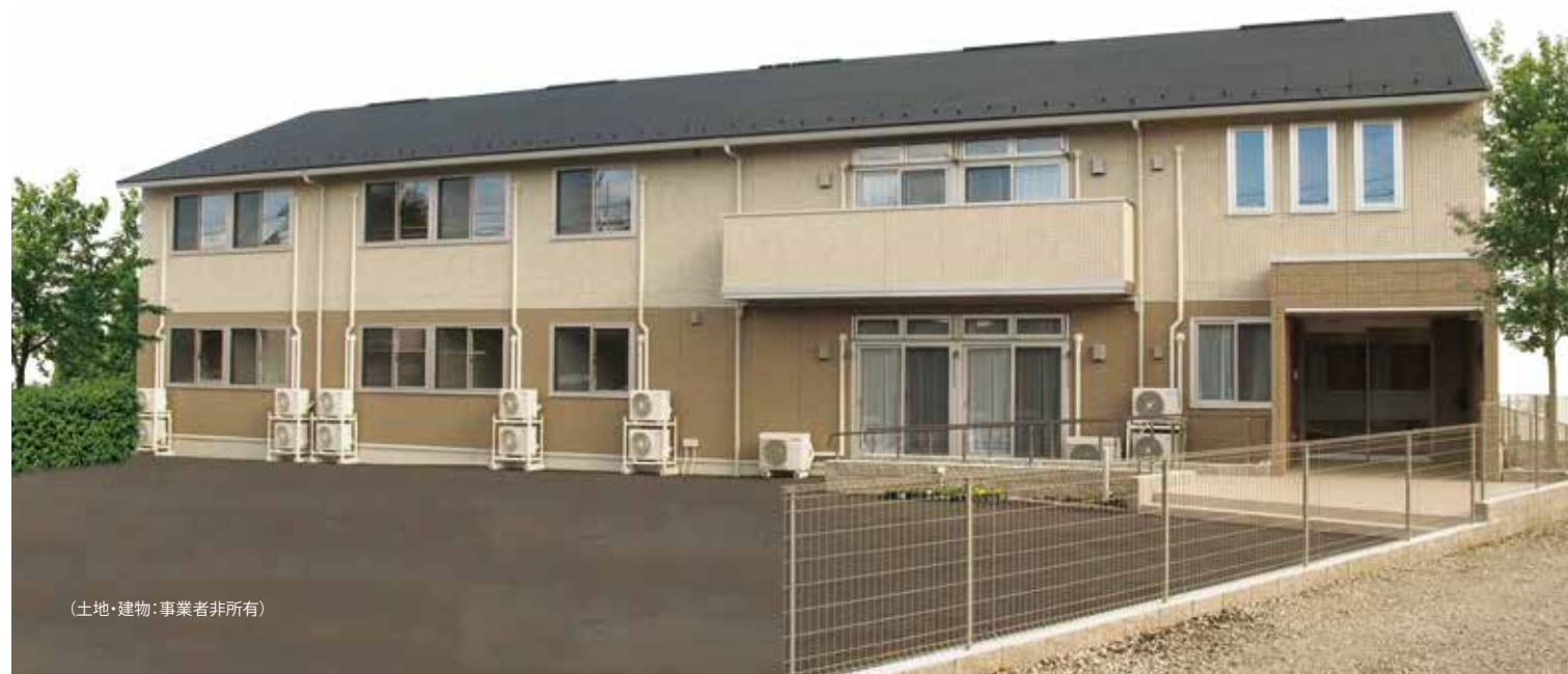
(土地・建物：事業者非所有)