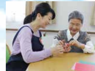
※写真はイメージ写真です