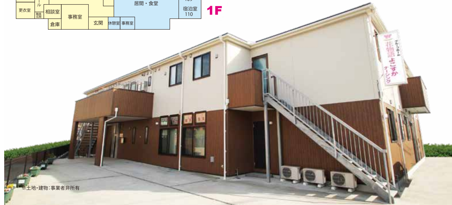
※土地・建物:事業者非所有