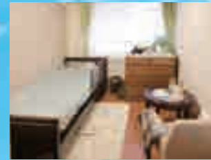
(写真はグループ他施設の居室)