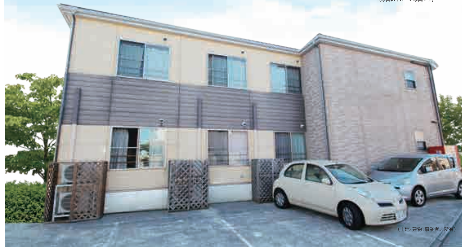
(土地・建物・事業者非所有)