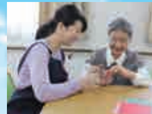
(写真はイメージ写真です)