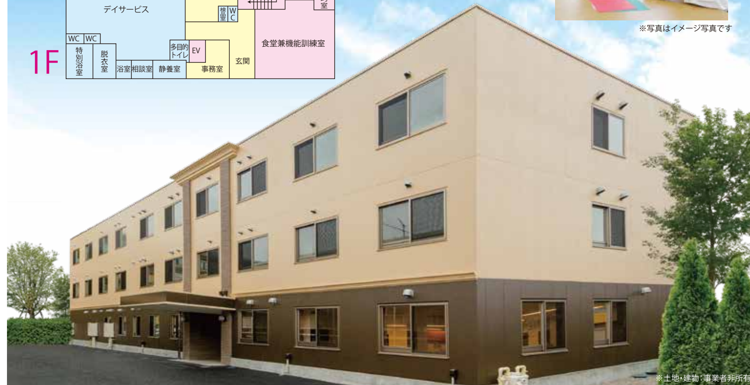
※土地・建物：事業者非所有