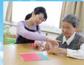
※写真はイメージ写真です