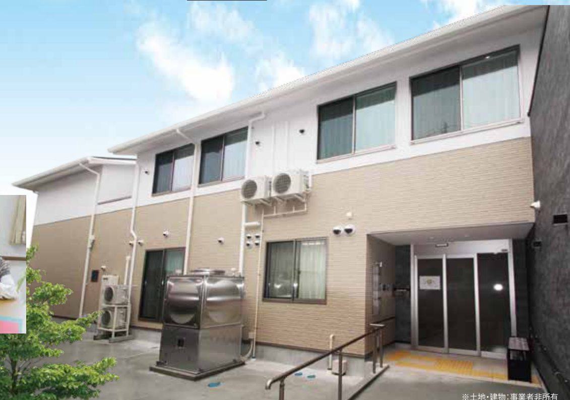
※土地・建物：事業者非所有