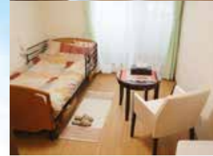
※写真はグループ他施設の設備