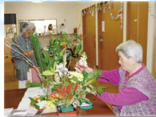
(写真はグループ他施設での生活の様子)