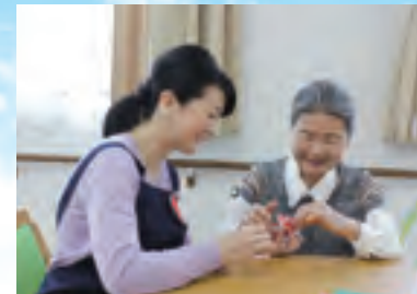
(写真はイメージ写真です)