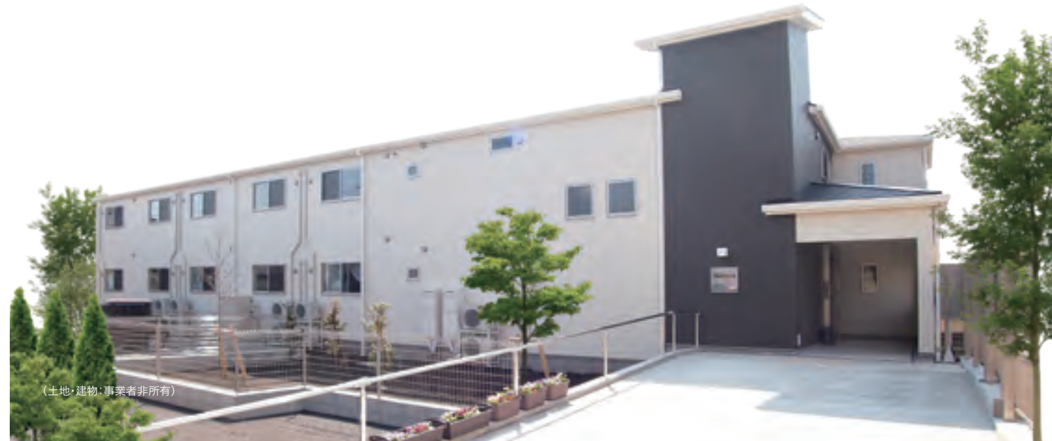
(土地・建物・事業者非所有)