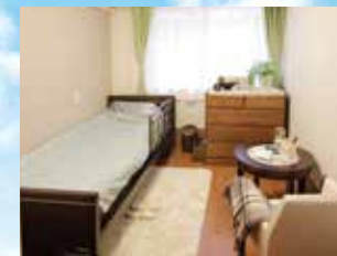
(写真はグループ他施設の居室)