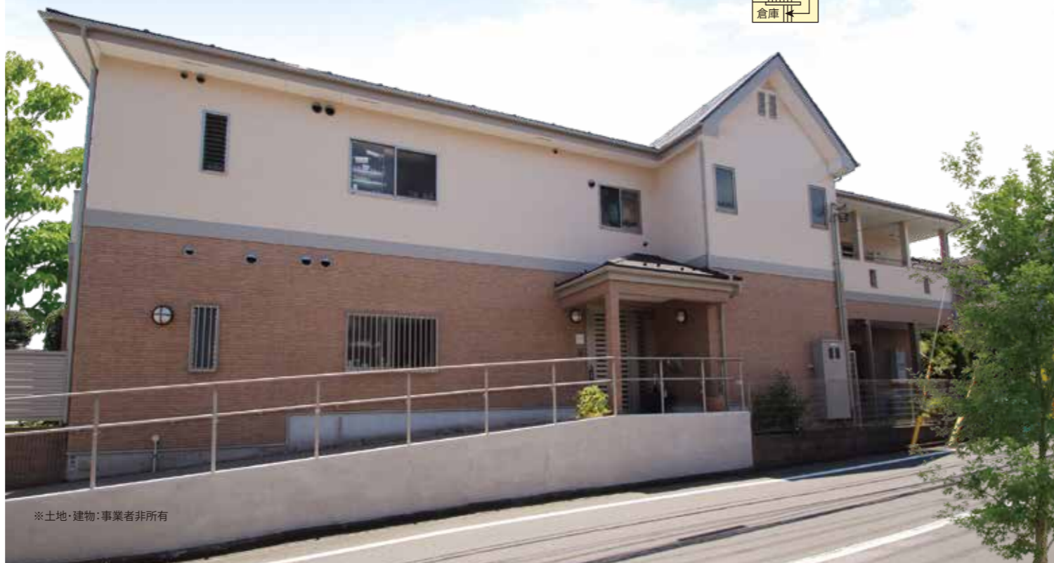
※土地・建物：事業者非所有