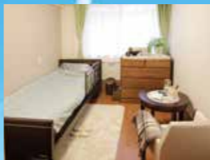
(写真はグループ他施設の居室)