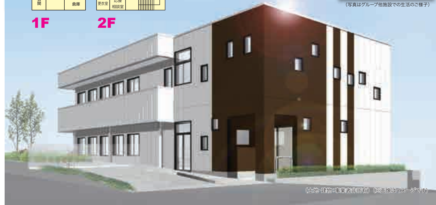
(土地・建物:事業者非所有) (※画像はイメージです)