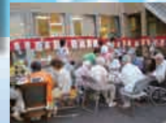
(写真はグループ他施設での生活の様子)