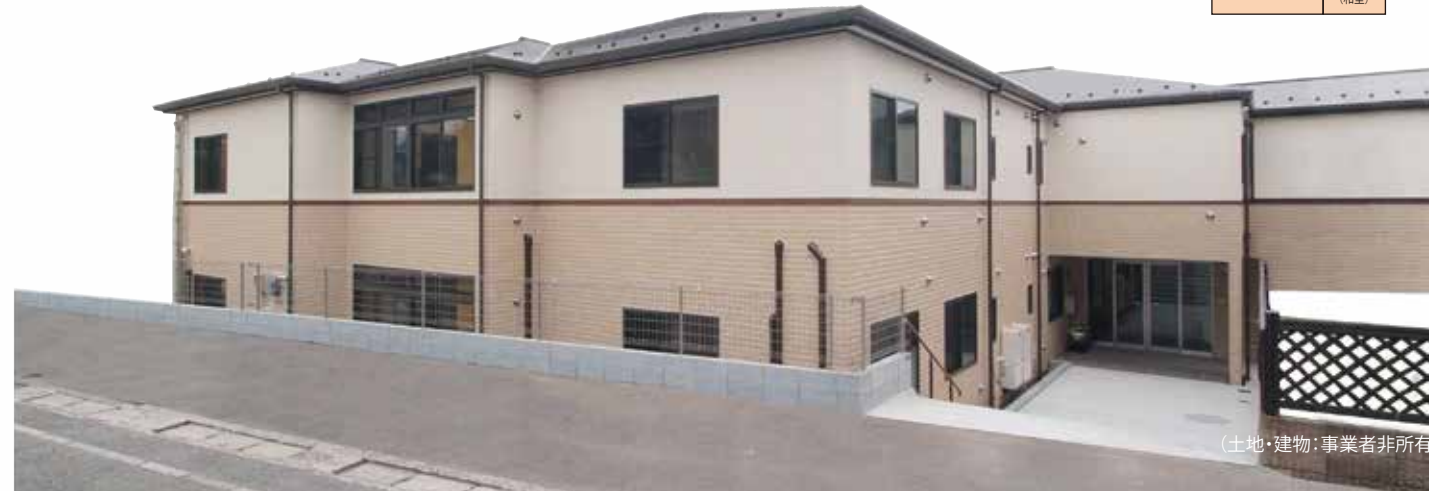
(土地・建物:事業者非所有)