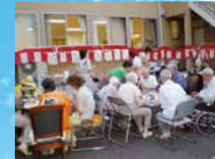
(写真はグループ他施設での生活の様子)