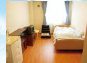
(写真は居室のイメージ)