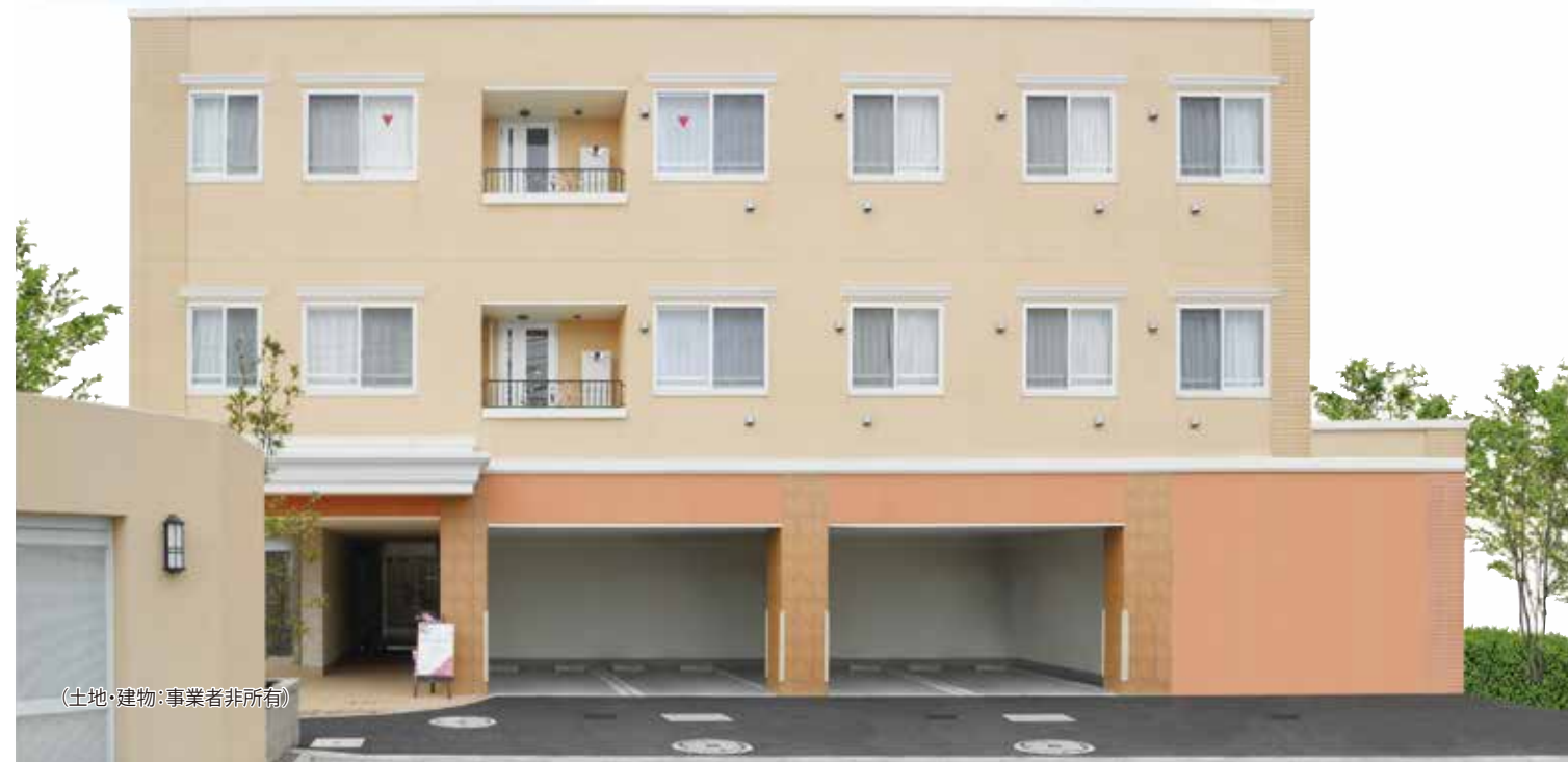
(土地・建物・事業者非所有)