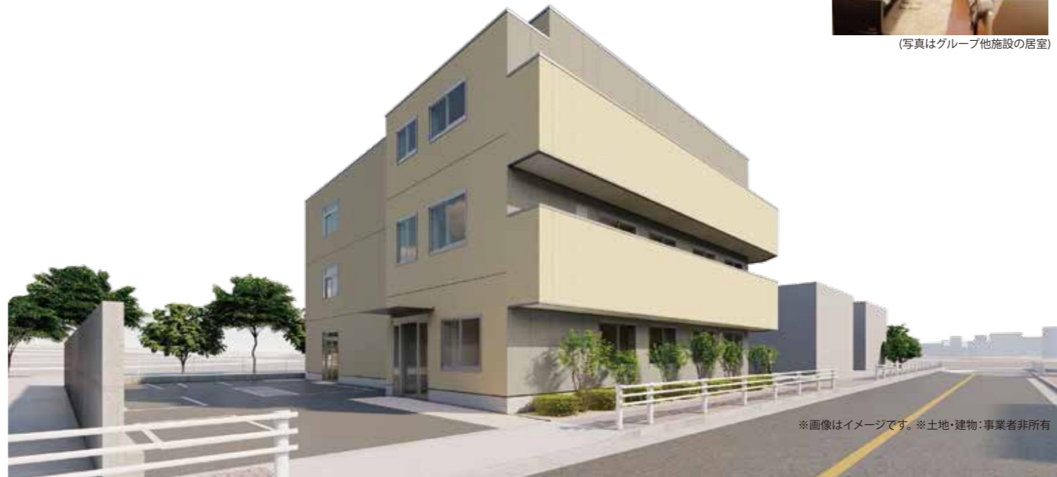
※画像はイメージです。※土地・建物：事業者非所有