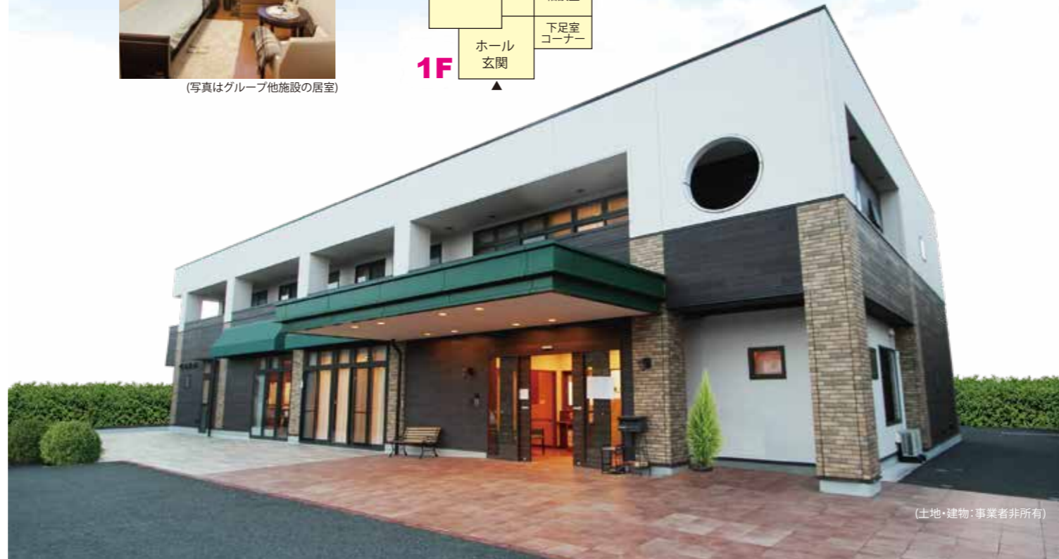
(土地・建物：事業者非所有)