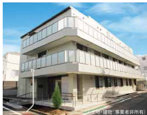
(土地・建物:事業者非所有)