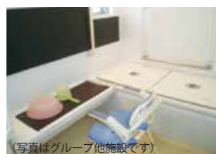
(写真はグループ他施設です)