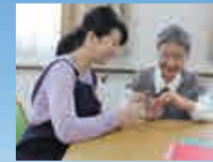
※写真はイメージ写真です