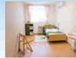
写真はグループ他施設の居室