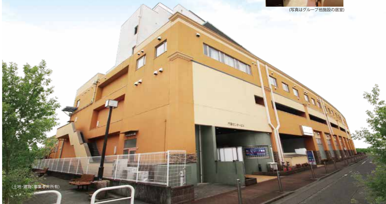
(土地・建物：事業者非所有)