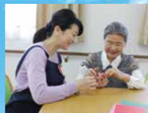
(写真はイメージ写真です)