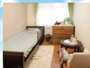
(写真はグループ他施設の居室)