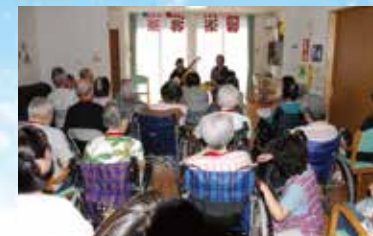
(写真はグループ他施設での生活の様子)