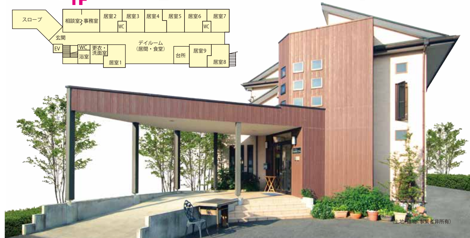
(土地・建物、事業者非所有)