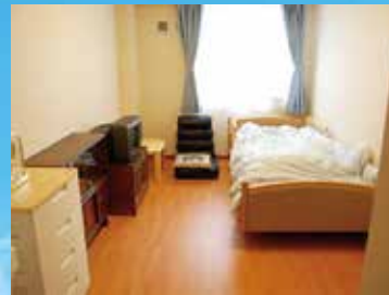
(写真は居室のイメージ)