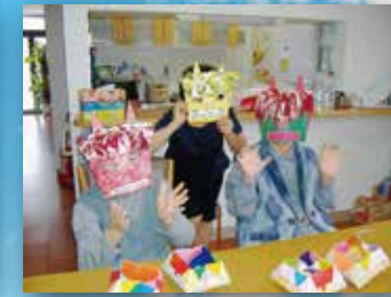
(写真はグループ他施設での生活の様子)