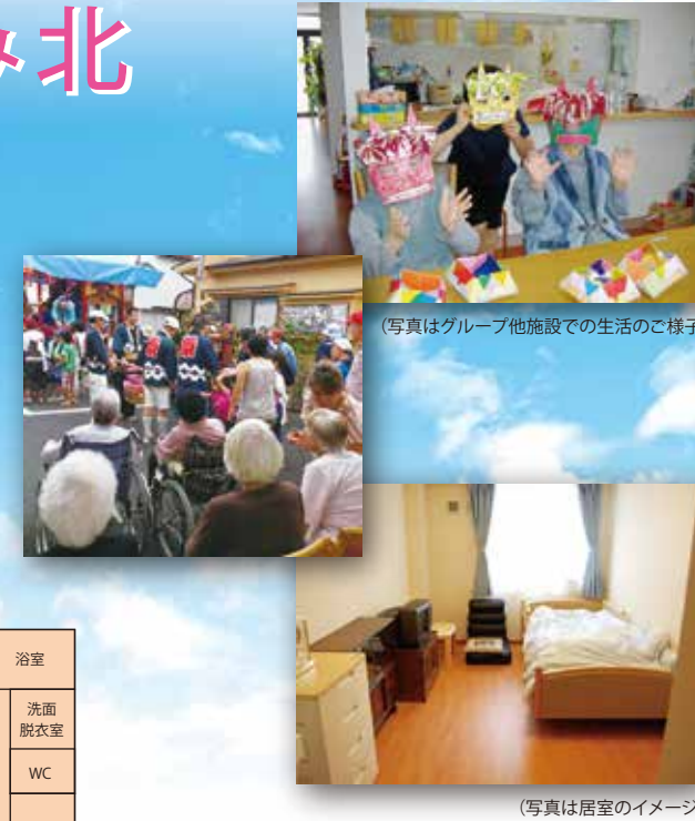
(写真はグループ他施設での生活の様子)