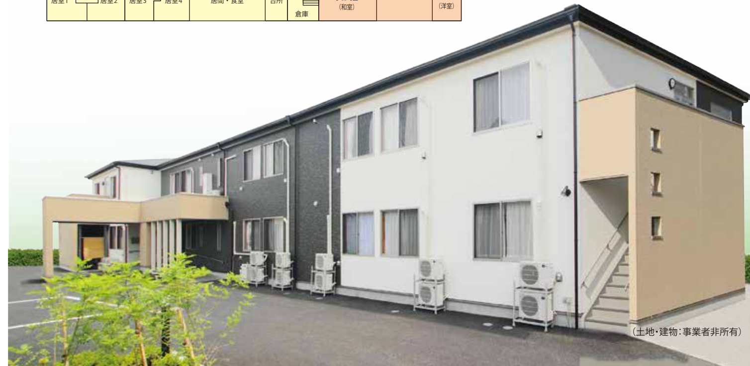
(土地・建物・事業者非所有)