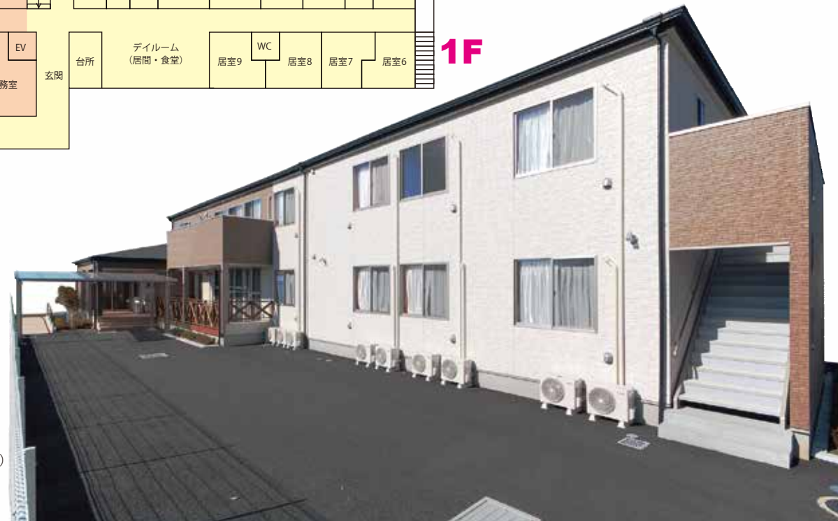
(土地・建物：事業者非所有)