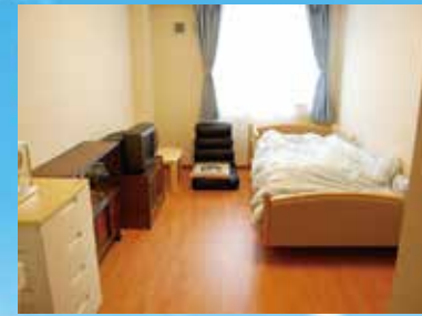
(写真は居室のイメージ)