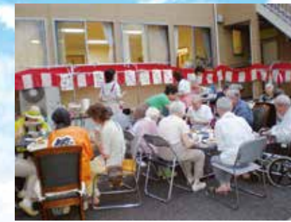
(写真はグループ他施設での生活の様子)