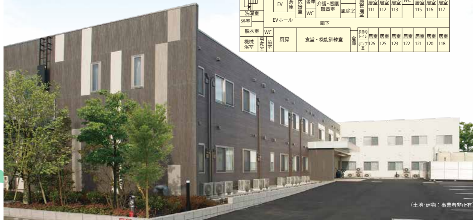
(土地・建物：事業者非所有)