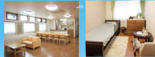
(写真はグループ他施設の居室)