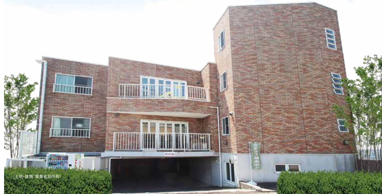
(土地・建物・事業者非所有)