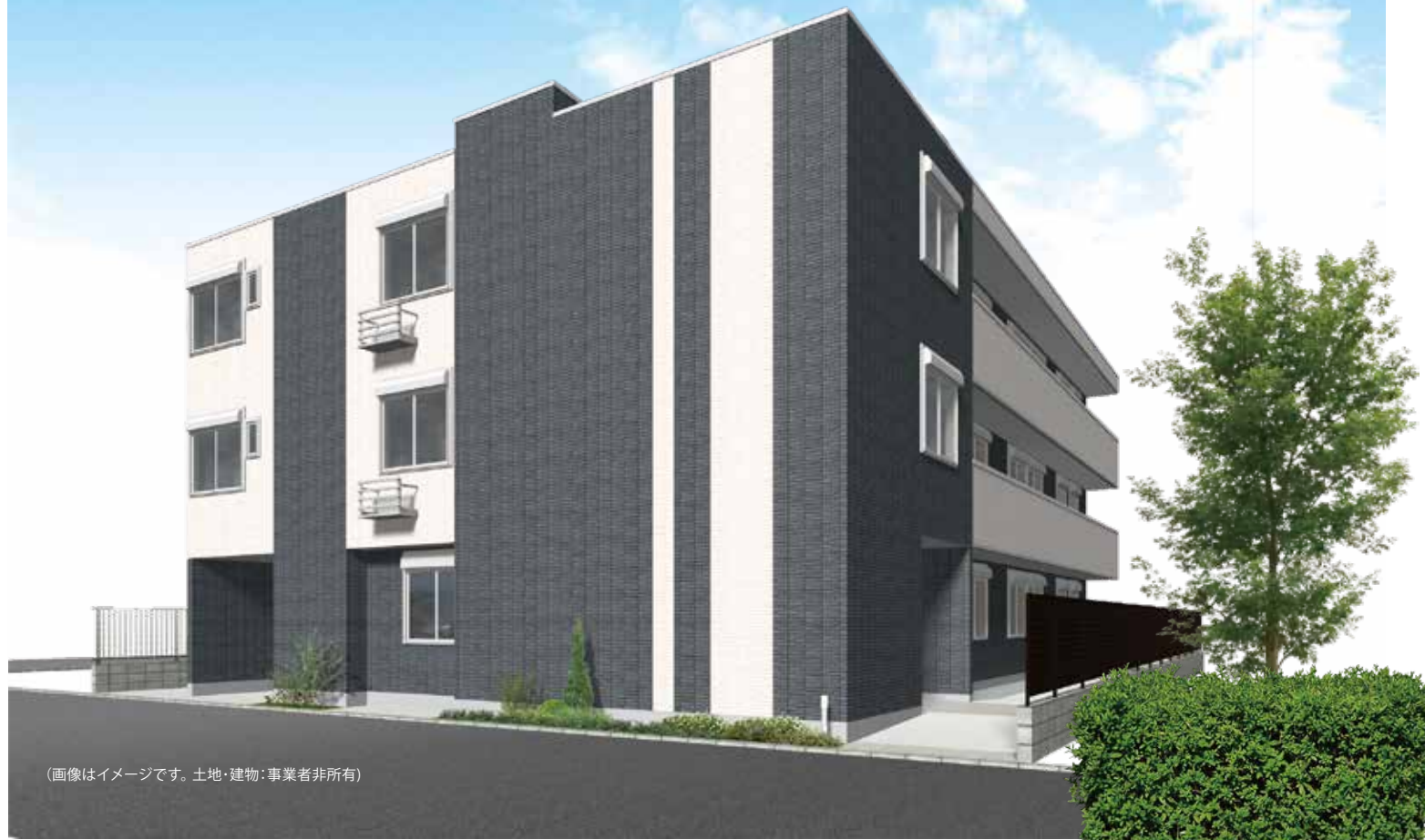
(画像はイメージです。土地・建物：事業者非所有)