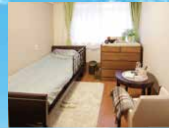
(写真はグループ他施設の居室)