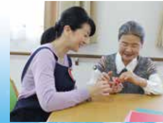
(写真はイメージ写真です)