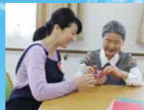
(写真はイメージ写真です)