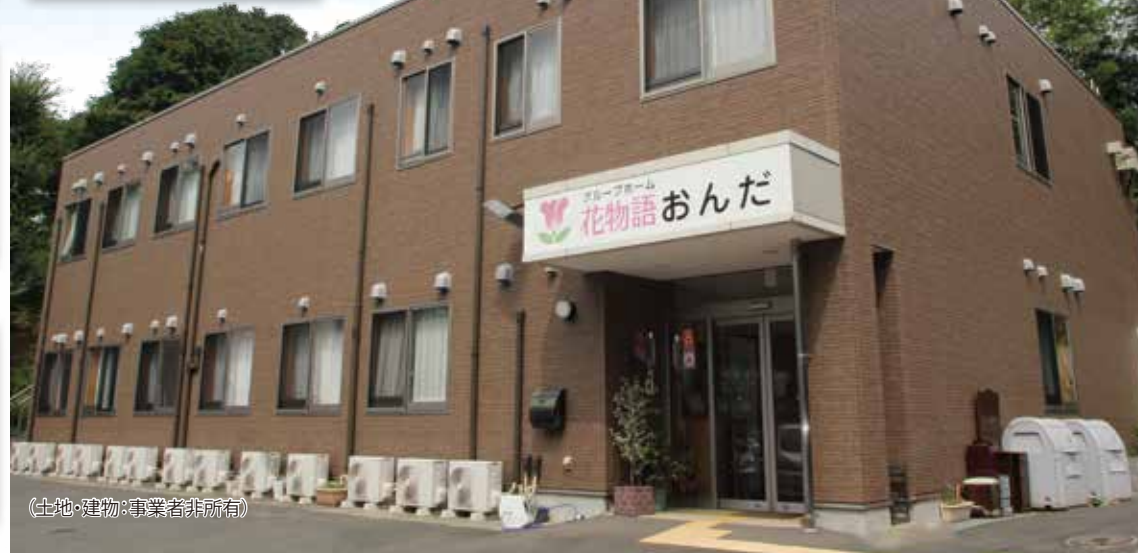
(土地・建物・事業者非所有)