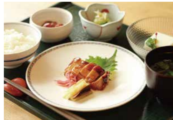
毎日の楽しみ家庭的で心をこめたお食事