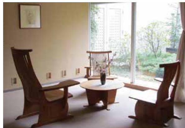
全館バリアフリー、床暖房完備