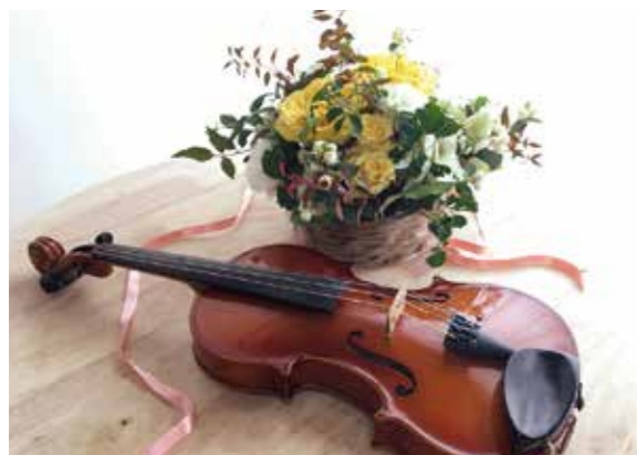
機能訓練や楽しいイベントも各種