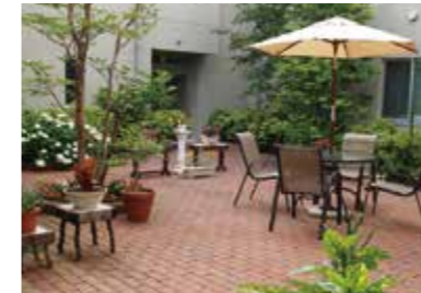
四季折々の美しさを楽しめる中庭