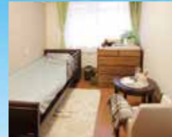
(写真はグループ他施設の居室)