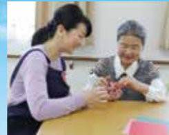
(写真はイメージ写真です)