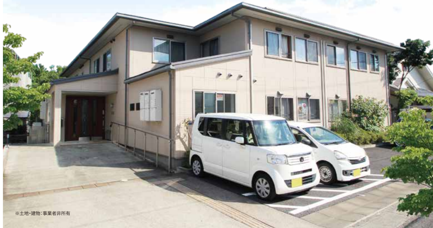
※土地・建物：事業者非所有