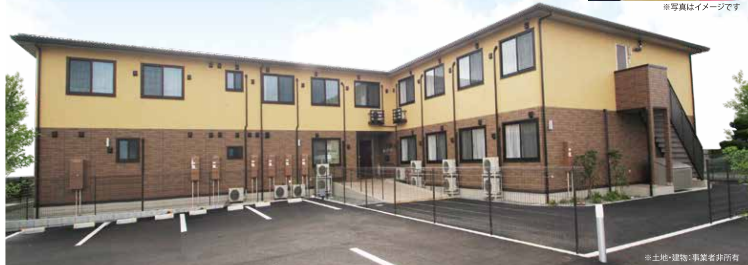
※土地・建物：事業者非所有