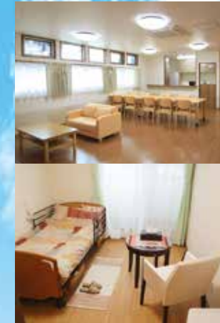
※写真はグループ他施設の設備