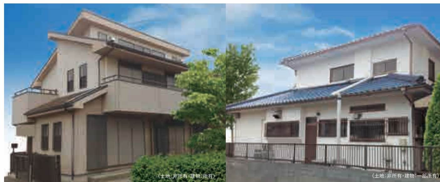
(土地:非所有・建物:所有)