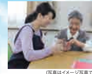
(写真はイメージ写真です)