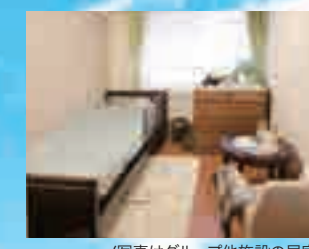
(写真はグループ他施設の居室)