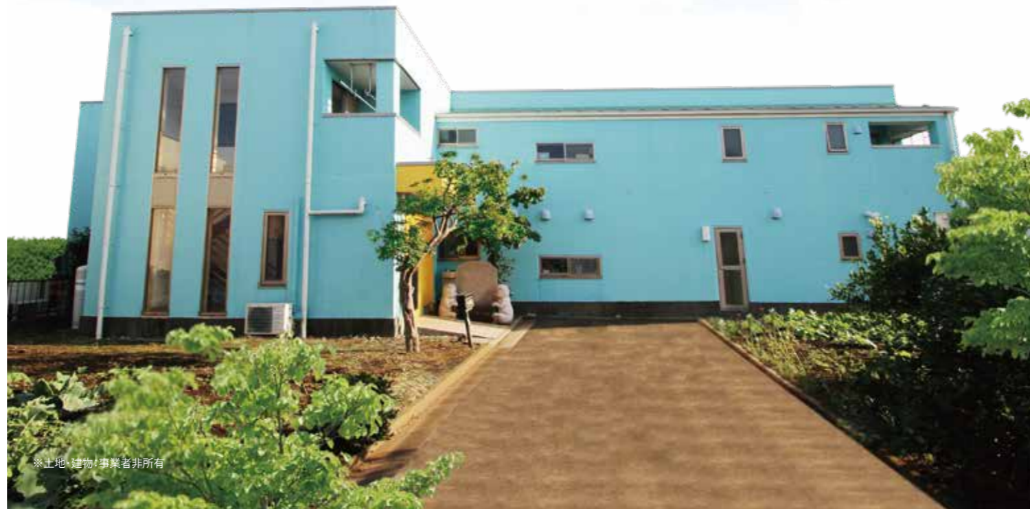
※土地・建物・事業者非所有