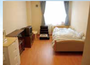
(写真は居室のイメージ)