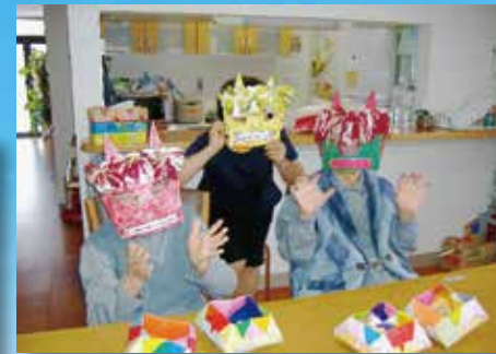
(写真はグループ他施設での生活の様子)