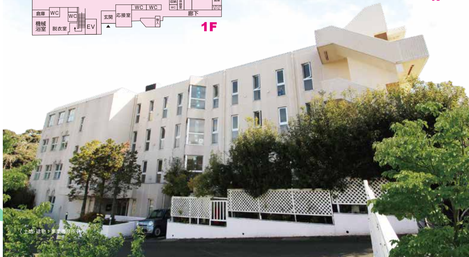
(土地・建物：事業者非所有)