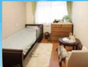
(写真はグループ他施設の居室)