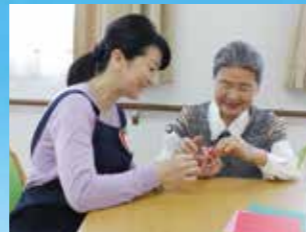
(写真はイメージ写真です)