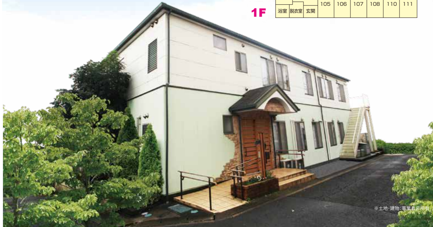
※土地・建物：事業者非所有