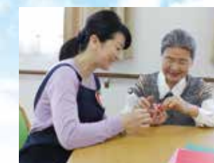
(写真はイメージ写真です)