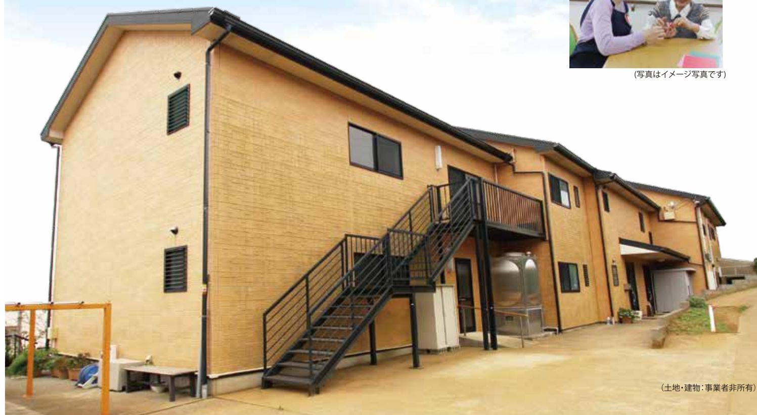
(土地・建物:事業者非所有)