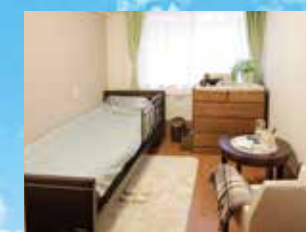
(写真はグループ他施設の居室)