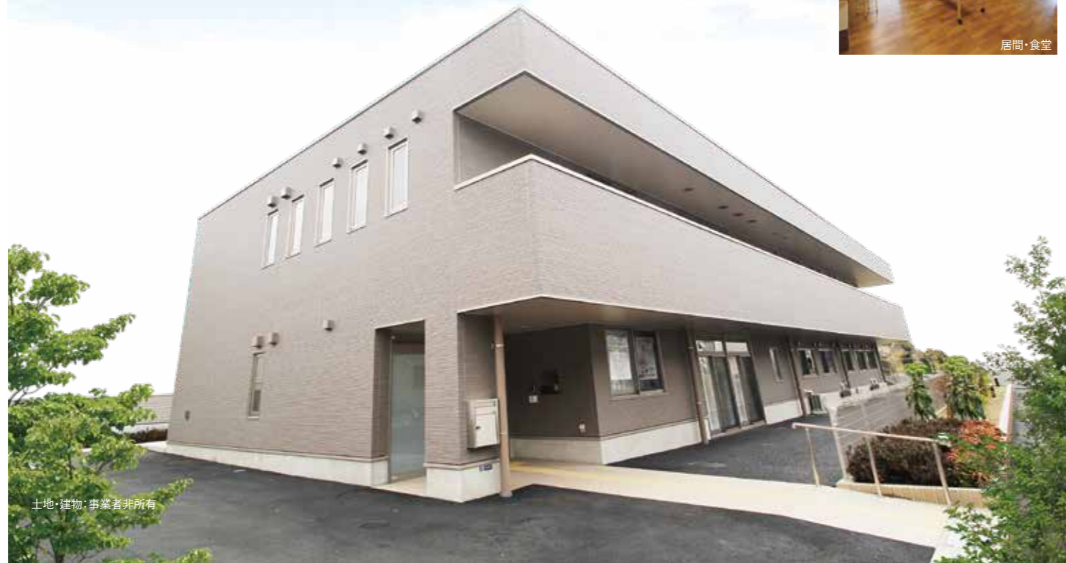
土地・建物：事業者非所有