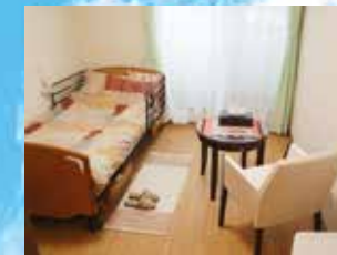
※写真はグループ他施設の設備