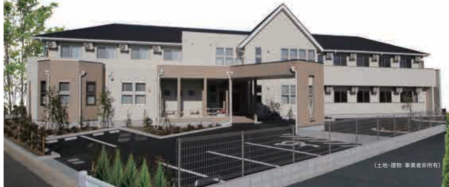
(土地・建物:事業者非所有)