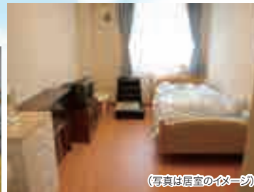
(写真は居室のイメージ)