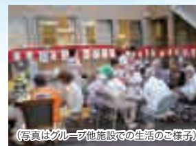
(写真はグループホームでの生活の様子)