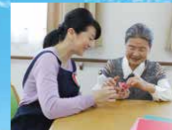
(写真はイメージ写真です)