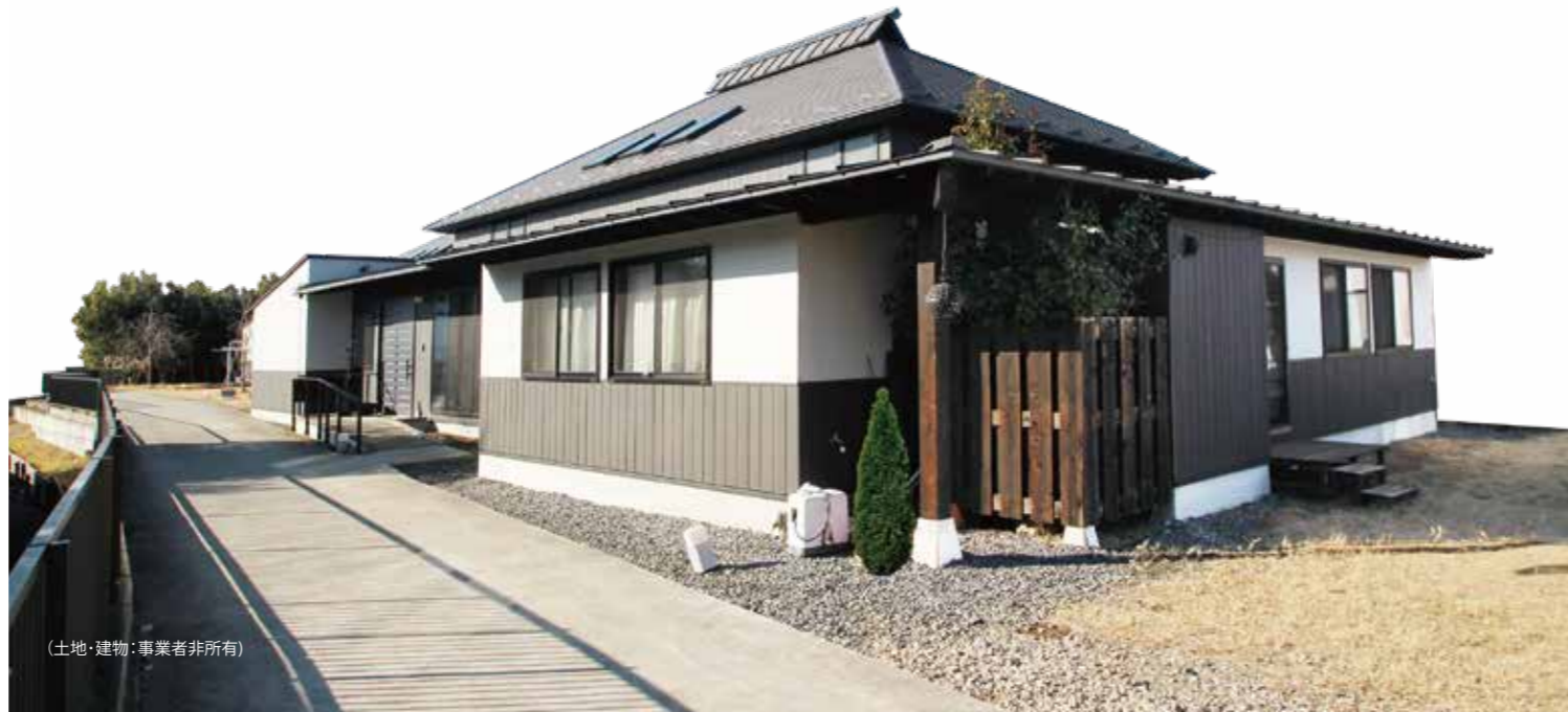
(土地・建物：事業者非所有)