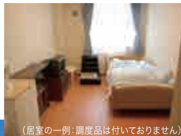
(居室の一例: 調度品は付いておりません)