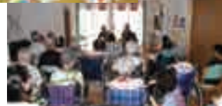
(写真はグループ他施設での生活の様子)