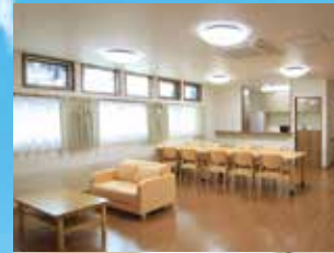
※写真はグループ他施設の設備