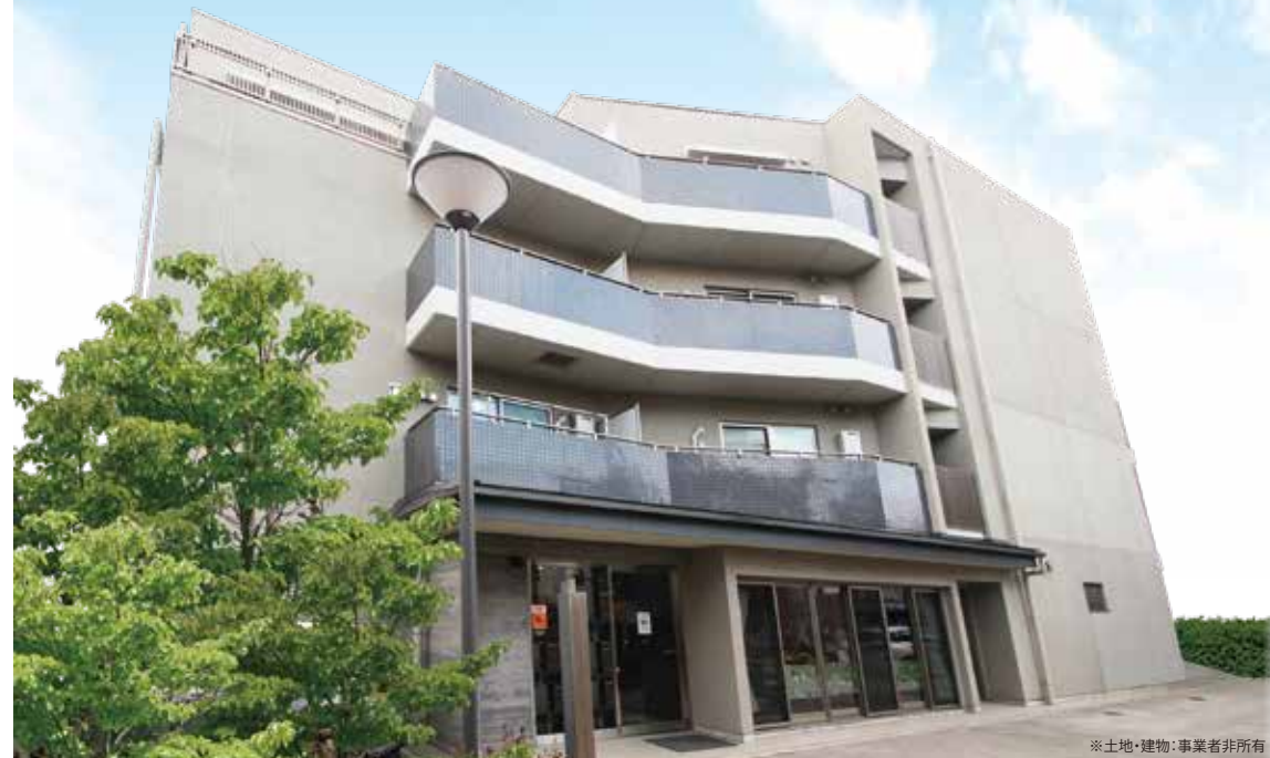
※土地・建物・事業者非所有