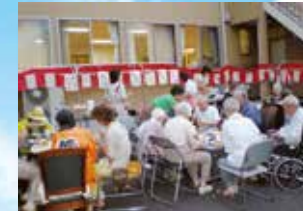
(写真はグループ施設での生活の様子)