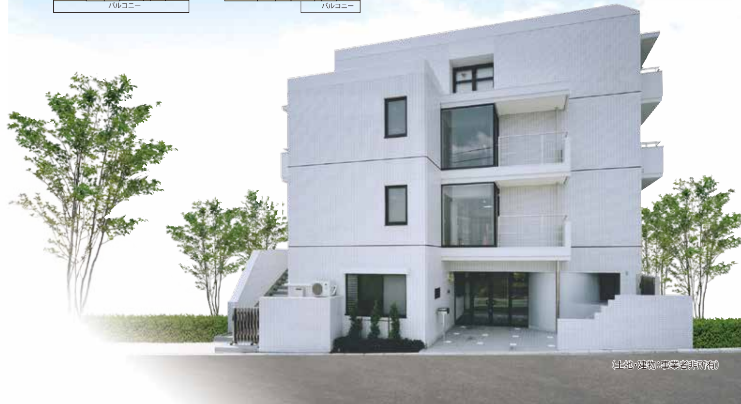
(土地・建物:事業者非所有)