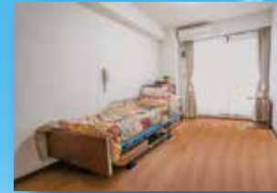
(写真は居室のイメージ)