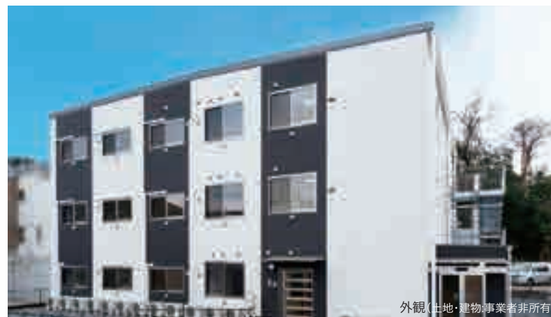
外観(土地・建物事業者非所有)