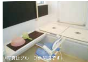
(写真はグループ他施設です)