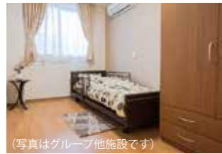
(写真はグループ他施設です)