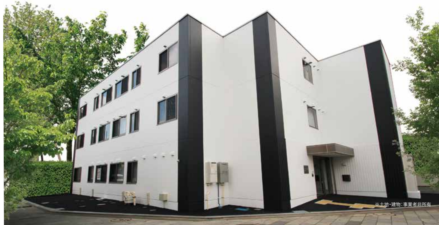
※土地・建物：事業者非所有