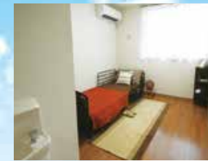
※グループ他施設の写真です