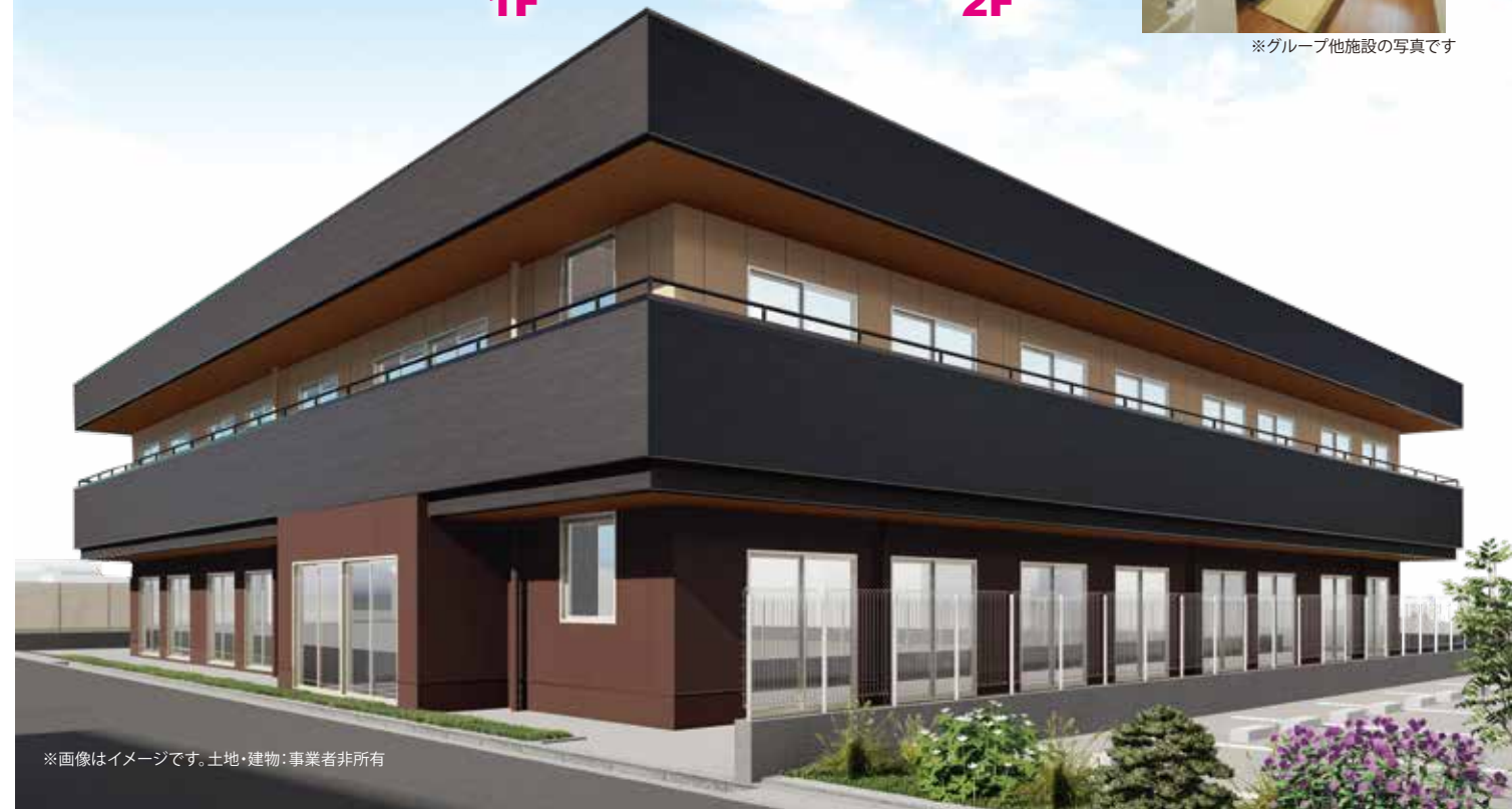
※画像はイメージです。土地・建物：事業者非所有